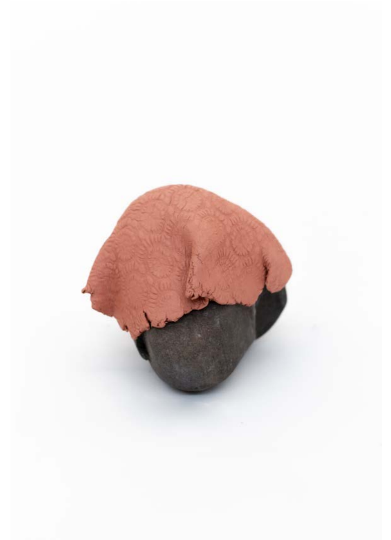
Elvira Smeke Lace Stones, 2021 Piedra, barro