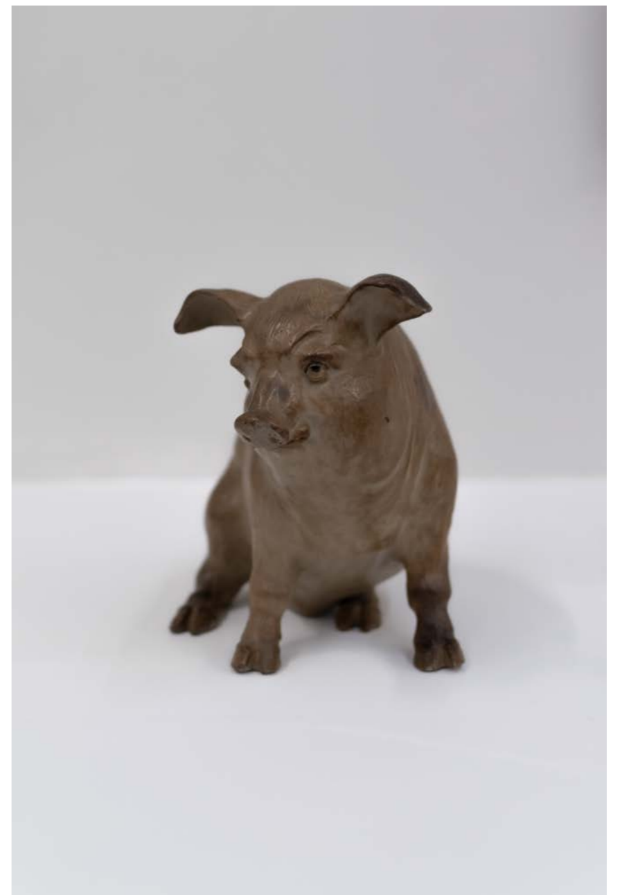
Atribuido a Pantaleón Panduro Alcancía Cerdo grande Barro moldeado 25 x 18 x 30 cm