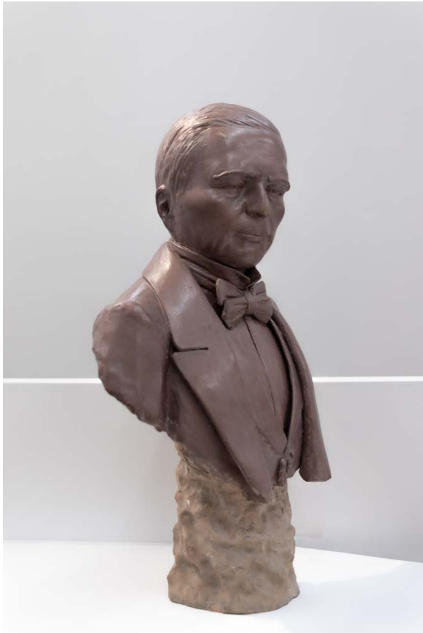
Escuela Pantaleón Panduro Benito. Juárez Barro Moldeado 75 x 53 x 30 cm