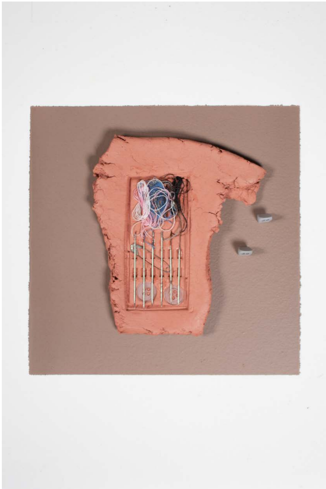
Elvira Smeke Sewing Kits on Clay, 2020 Objetos varios