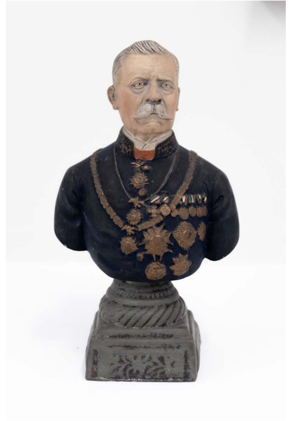
Escuela Pantaleón Panduro, Prudencio y Emanuel Zúñiga Porfirio Díaz Barro moldeado 28 x 16 x 12 cm