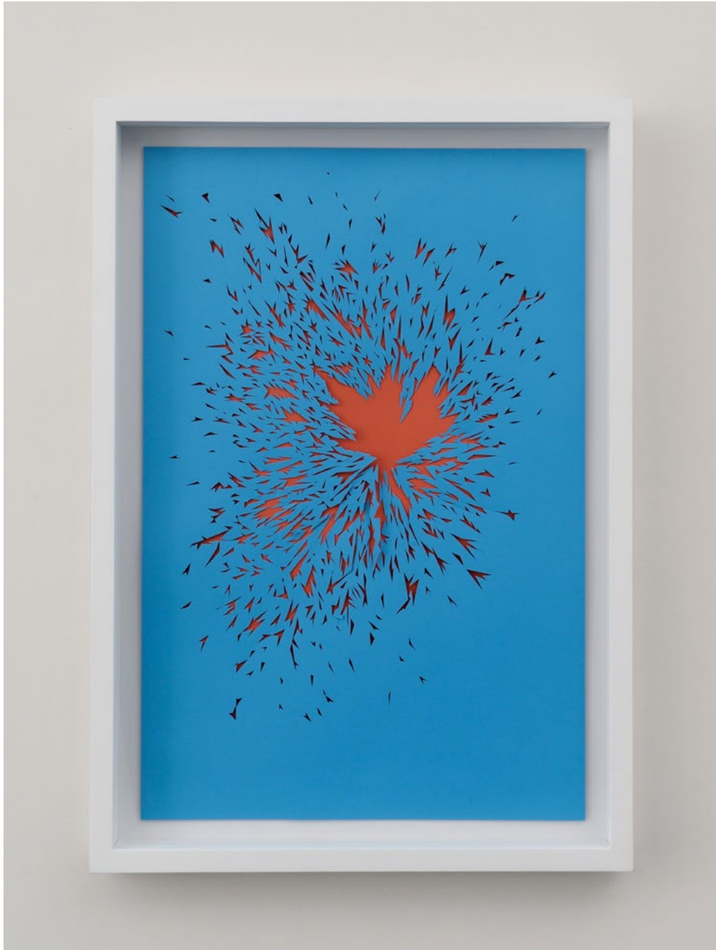
Cristina Ochoa (1976) Supernova (azul), 2016 Perforated cotton paper Framed Dimensions: 39.37 x 27.56 x 2.76 " 100 x 70 x 7 cm. Edition unique