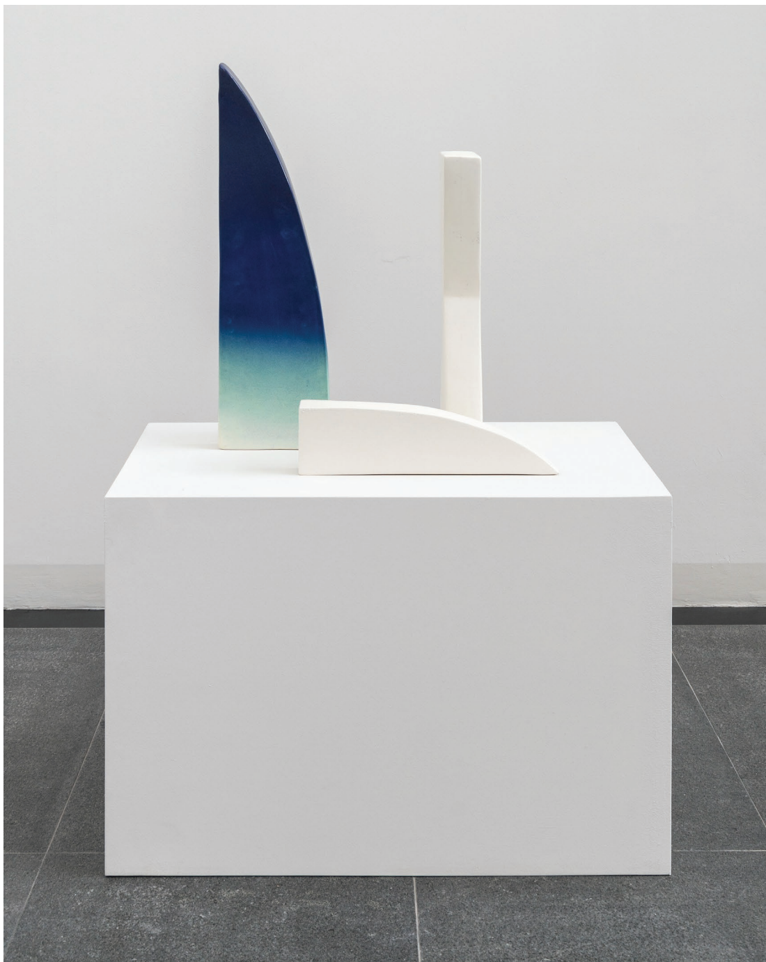
Untitled, 2016 3 objetos en cerámica Dimensiones: variables Edición de 2, más 1 Prueba de Artista Inv# 4497.1