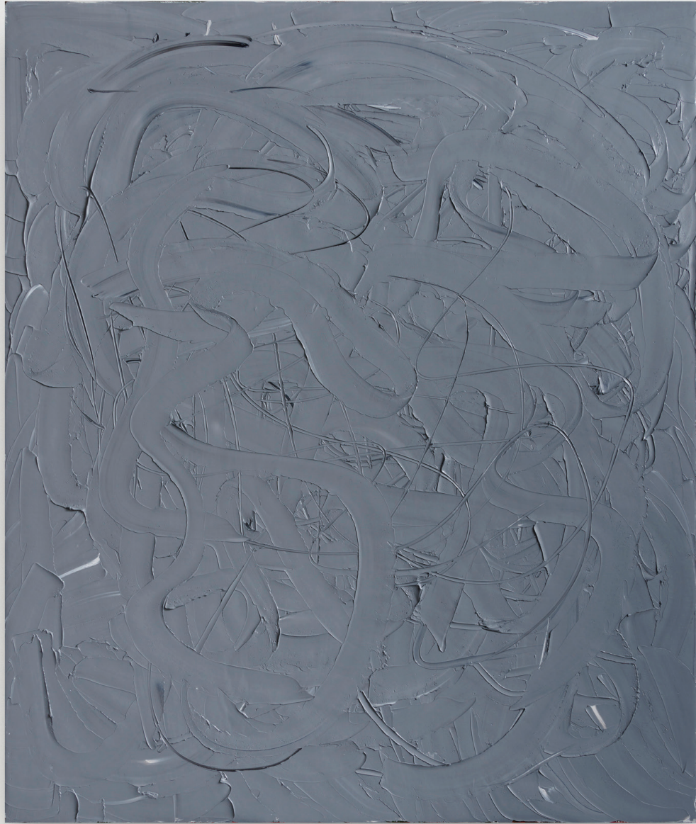
Gray Mass II, 2016 Óleo sobre lino 83 x 60 in. 210.8 x 177.8 cm.