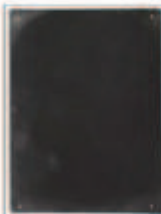
LIAT YOSSFIFOR Dust dance 15 , 2016 graphite powder oil and water on paper 9 x 12 " 22.9 x 30.5 cm. Edition unique Inv# 4938.unique