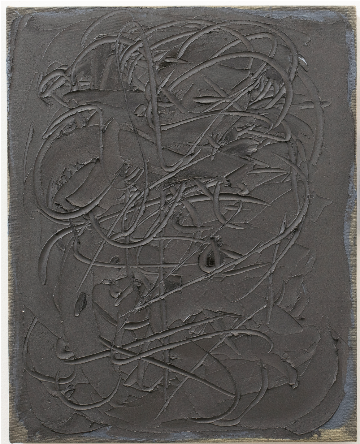
Figure II, 2016 Óleo sobre lino 20 x 16 in. 50.8 x 40.6 cm.