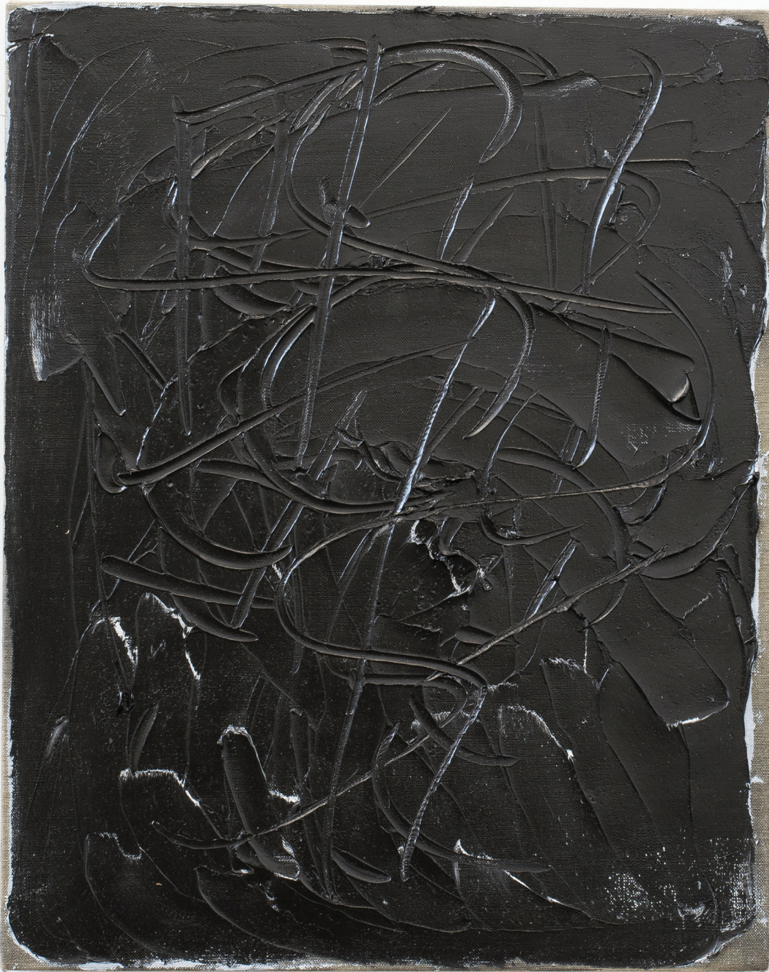
Figure I, 2016 Óleo sobre lino 20 x 16 in. 50.8 x 40.6 cm.