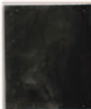
LIAT YOSSFIFOR Dust dance 12 , 2016 graphite powder oil and water on paper 12 x 10 " 30.5 x 25.4 cm. Edition unique Inv# 4935.unique