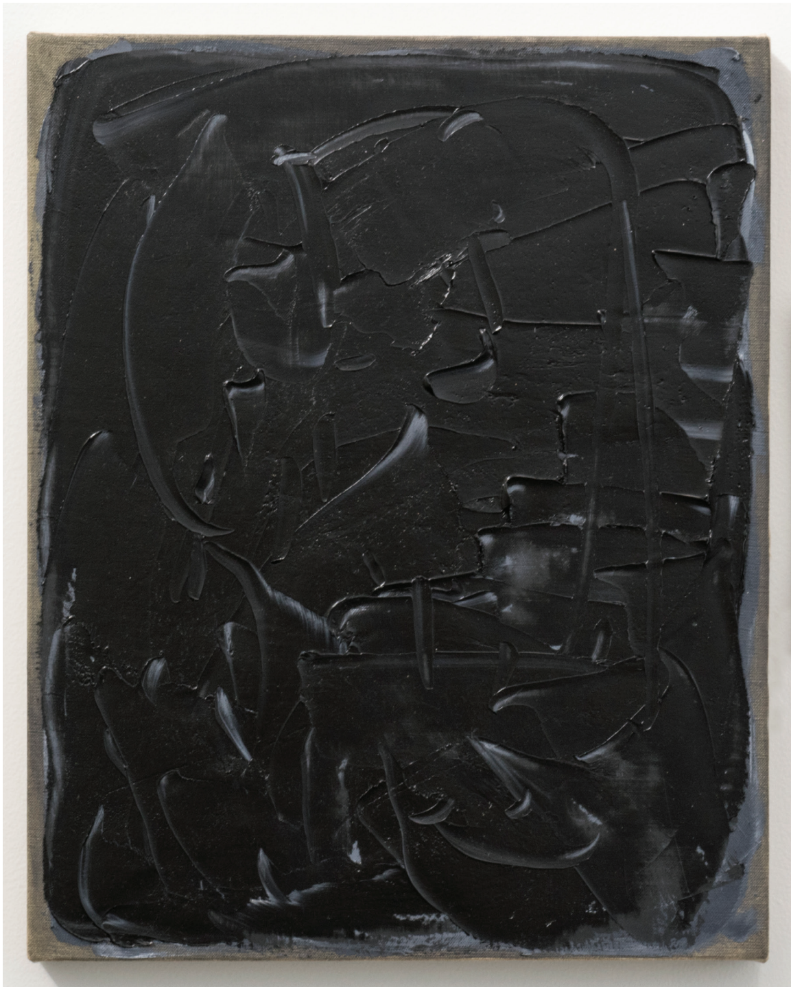
Figure III, 2016 Óleo sobre lino 20 x 16 in. 50.8 x 40.6 cm.