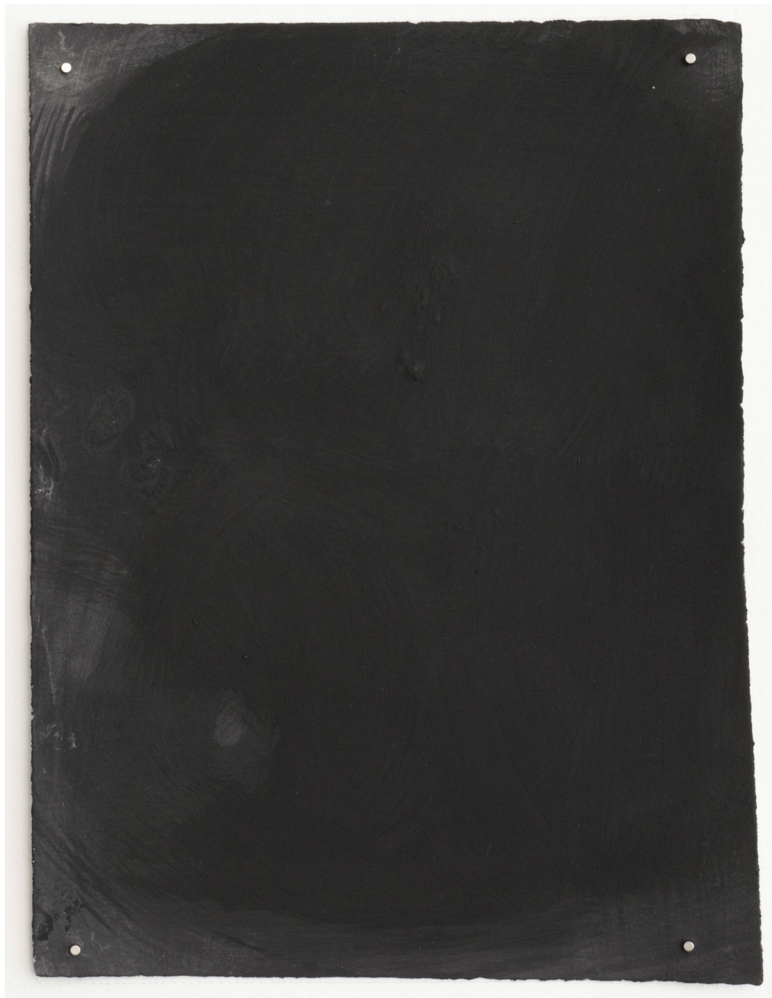
Dust dance 15, 2016 Polvo de grafito, óleo y agua sobre papel 9 x 12 in. 22.9 x 30.5 cm.