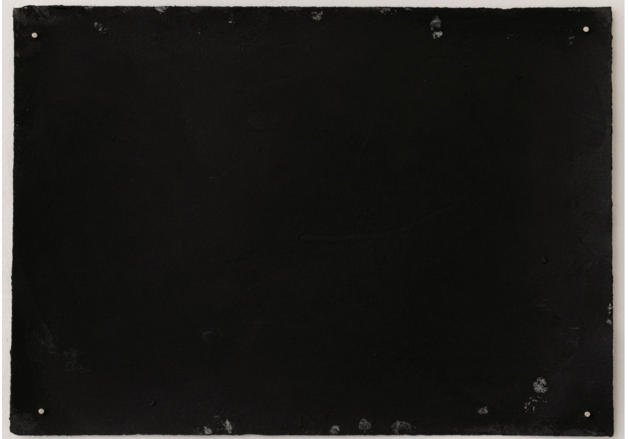
Dust dance 2, 2016 Polvo de grafito, óleo y agua sobre papel 10 x 13.5 in. 25.4 x 34.3 cm.