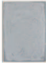
LIAT YOSSFIFOR Gray swirl II , 2016 Oil on linen Dimensions: 42 x 30 " 106.7 x 76.2 cm. Edition unique Inv# 4302.unique