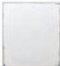
LIAT YOSSFIFOR White/Line , 2016 Oil on linen Dimensions: 90 x 80 " 228.6 x 203.2 cm. Edition unique Inv# 4307.unique