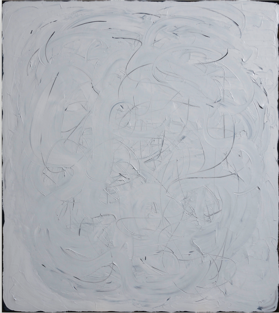
White/Line, 2016 Óleo sobre lino 90 x 80 in. 228.6 x 203.2 cm.