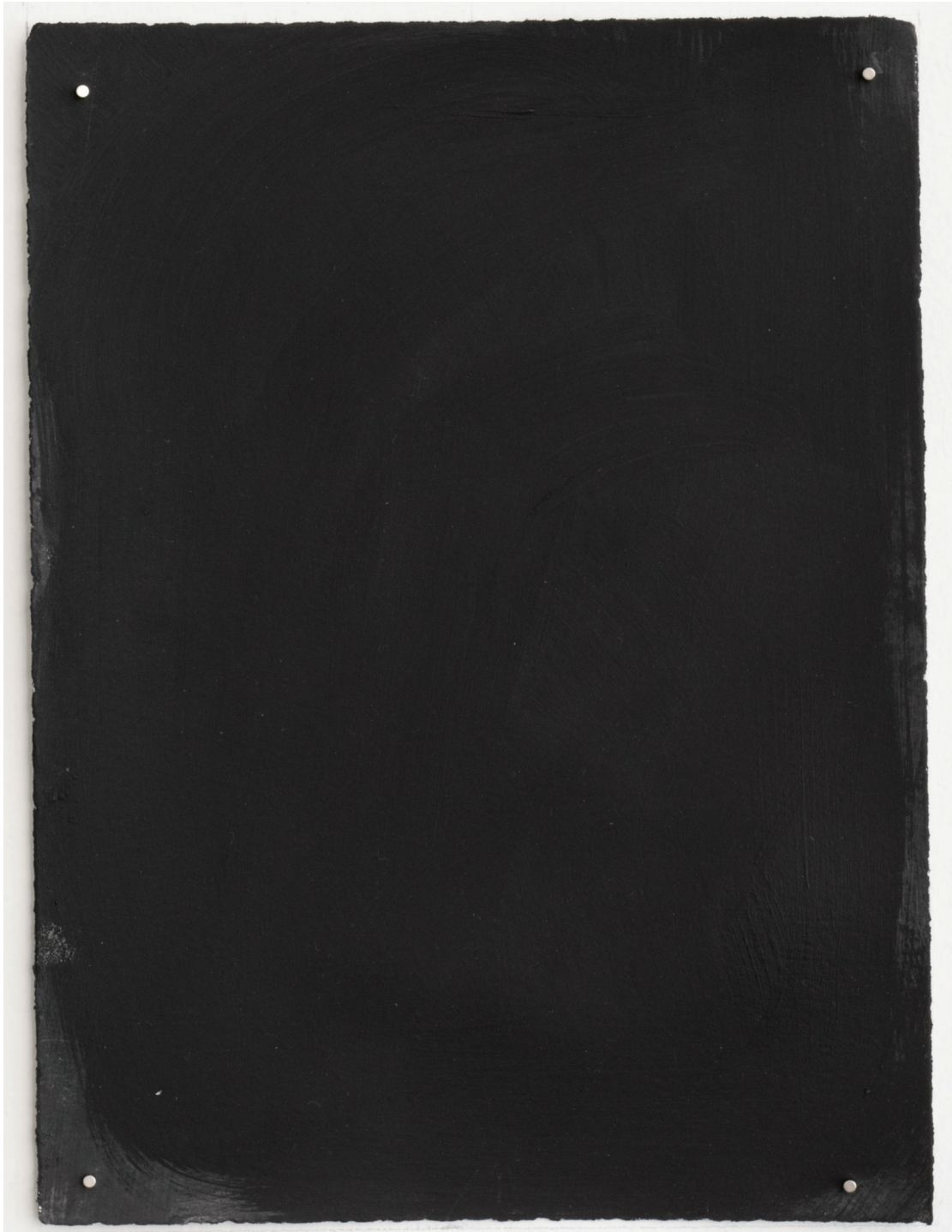
Dust dance 14, 2016 Polvo de grafito, óleo y agua sobre papel 9 x 12 in. 22.9 x 30.5 cm.