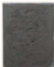
LIAT YOSSFIFOR Figure II , 2016 Oil on linen Dimensions: 20 x 16 " 50.8 x 40.6 cm. Edition unique Inv# 4299.unique