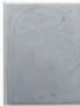
LIAT YOSSFIFOR Gray Mass I , 2016 Oil on linen Dimensions: 80 x 60 " 203.2 x 152.4 cm. Edition unique Inv# 4304.unique