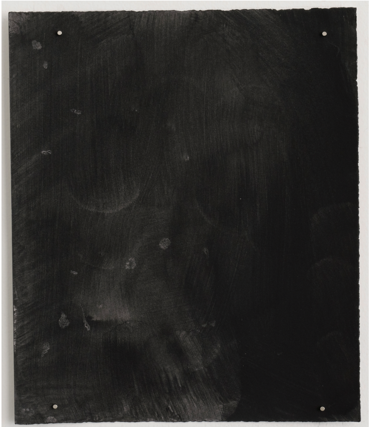
Dust dance 12, 2016 Polvo de grafito, óleo y agua sobre papel 12 x 10 in. 30.5 x 25.4 cm.