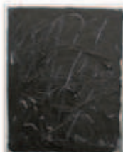
LIAT YOSSFIFOR Figure I , 2016 Oil on linen Dimensions: 20 x 16 " 50.8 x 40.6 cm. Edition unique Inv# 4298.unique