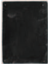
LIAT YOSSFIFOR Dust dance 10 , 2016 graphite powder oil and water on paper 9 x 12 " 22.9 x 30.5 cm. Edition unique Inv# 4933.unique