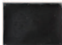
LIAT YOSSFIFOR Dust dance 1 , 2016 graphite powder oil and water on paper 10 x 13.5 " 25.4 x 34.3 cm. Edition unique Inv# 4924.unique