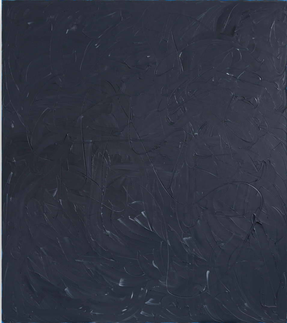
The Stand I, 2016 Óleo sobre lino 90 x 80 in. 228.6 x 203.2 cm.