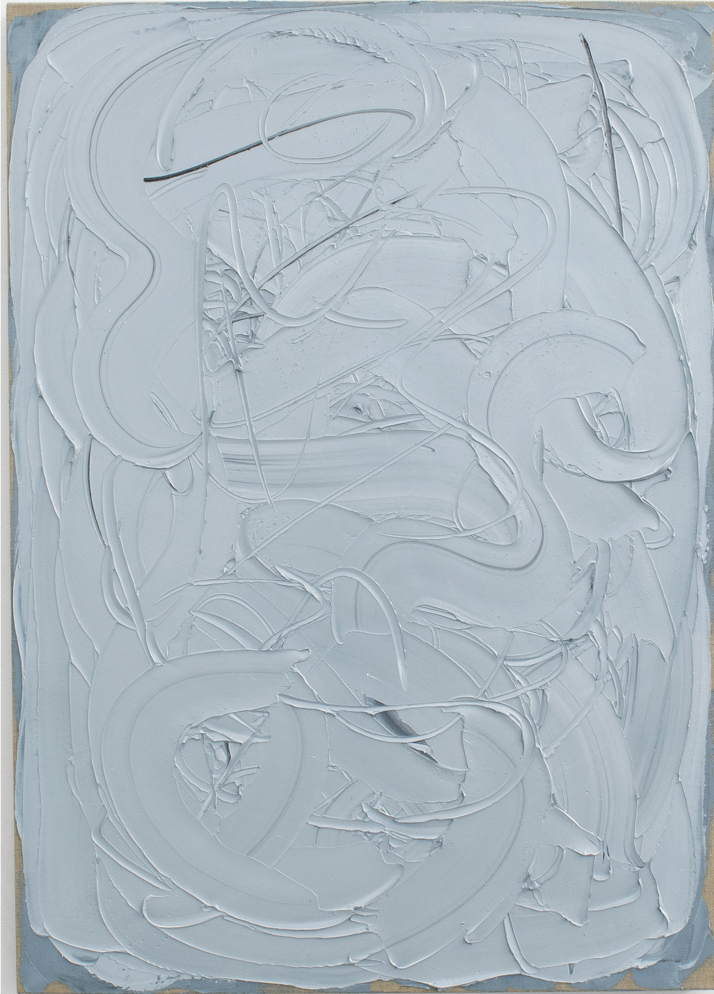
Gray Swirl I, 2016 Óleo sobre lino 90 x 80 in. 228.6 x 203.2 cm.