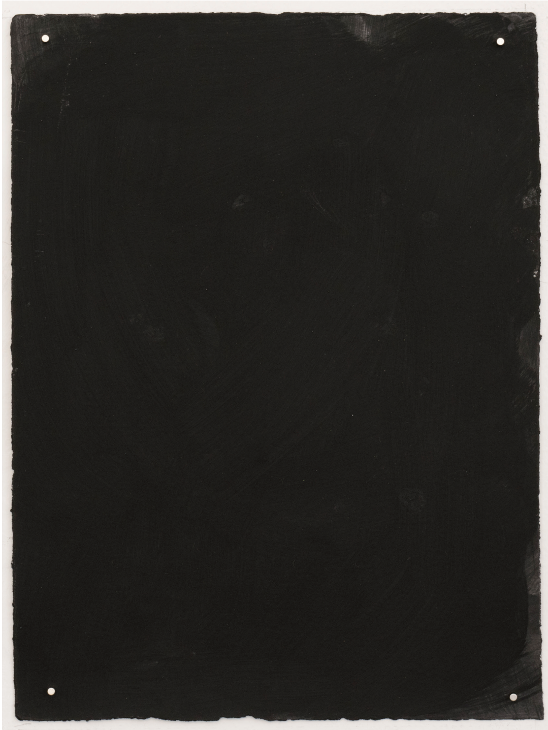
Dust dance 5, 2016 Polvo de grafito, óleo y agua sobre papel 9 x 10 in. 22.9 x 25.4 cm.