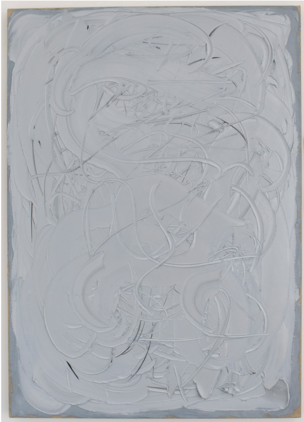
Gray Swirl I, 2016 Óleo sobre lino 90 x 80 in. 228.6 x 203.2 cm.