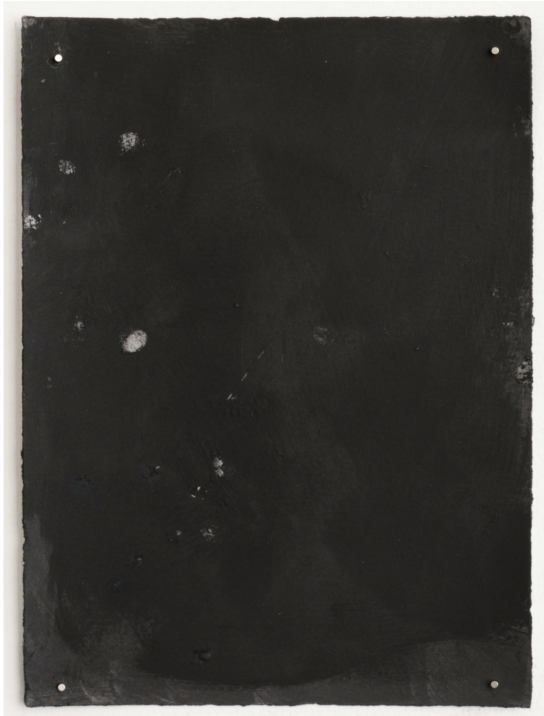
Dust dance 13, 2016 Polvo de grafito, óleo y agua sobre papel 9 x 12 in. 22.9 x 30.5 cm.