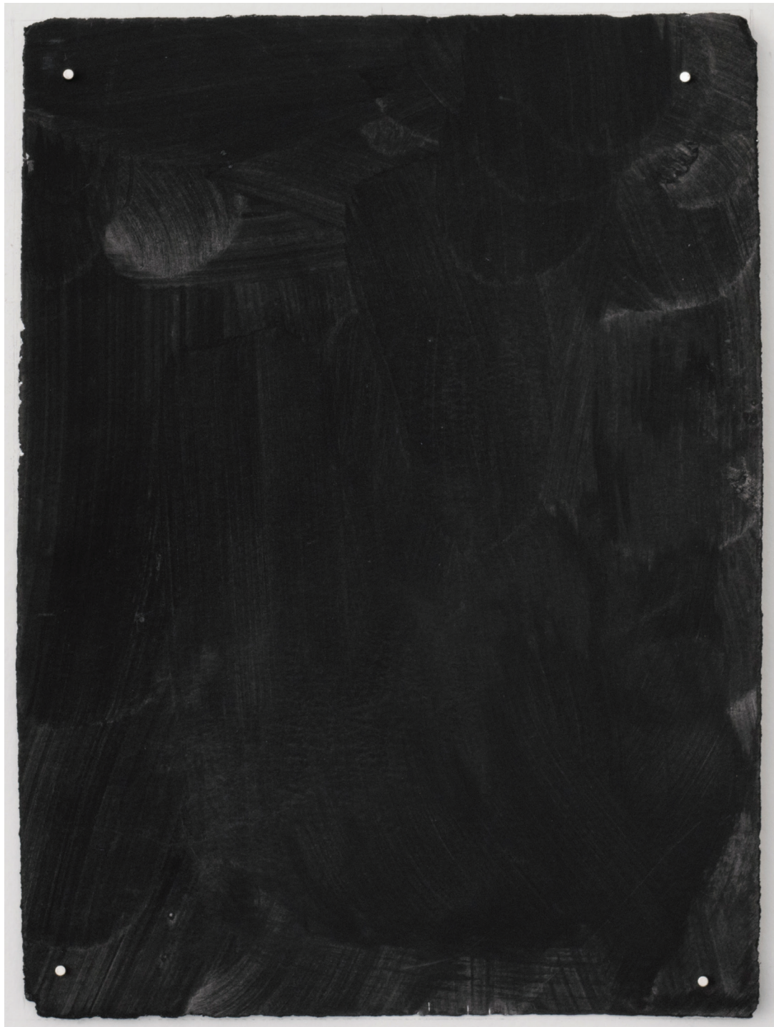
Dust dance 10, 2016 Polvo de grafito, óleo y agua sobre papel 9 x 10 in. 22.9 x 25.4 cm.