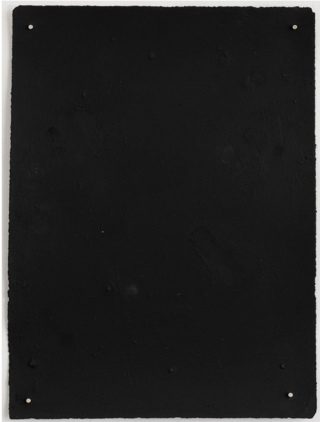
Dust dance 11, 2016 Polvo de grafito, óleo y agua sobre papel 9 x 10 in. 22.9 x 25.4 cm.