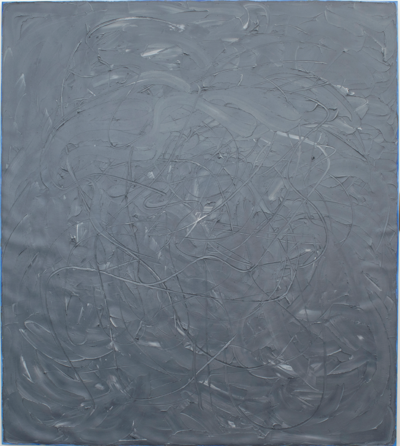
The Stand II, 2016 Óleo sobre lino 90 x 80 in. 228.6 x 203.2 cm.