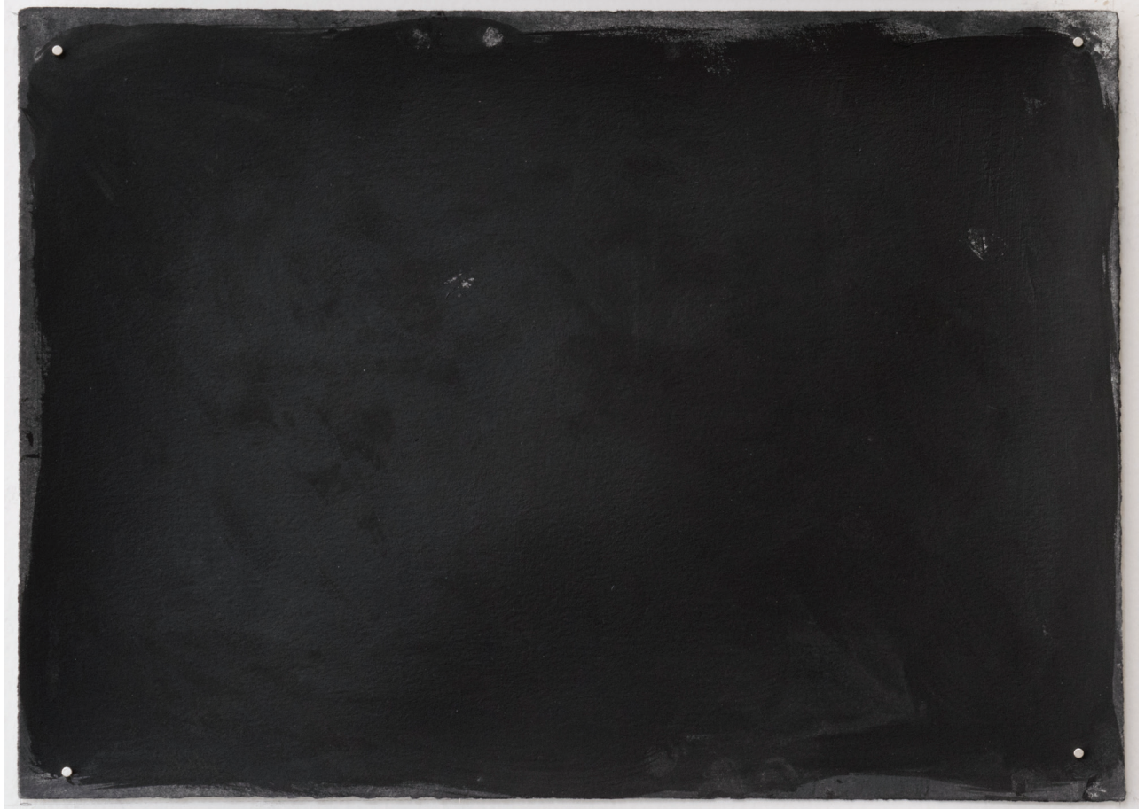
Dust dance 1, 2016 Polvo de grafito, óleo y agua sobre papel 10 x 13.5 in. 25.4 x 34.3 cm.