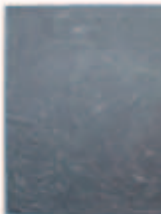
LIAT YOSSFIFOR The Stand II , 2016 oil on linen 90 x 80 " 228.6 x 203.2 cm. Edition unique Inv# 4939.unique