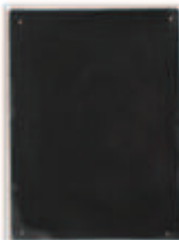
LIAT YOSSFIFOR Dust dance 14 , 2016 graphite powder oil and water on paper 9 x 12 " 22.9 x 30.5 cm. Edition unique Inv# 4937.unique