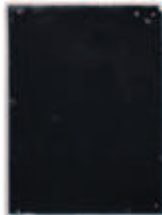
LIAT YOSSFIFOR Dust dance 9 , 2016 graphite powder oil and water on paper 9 x 12 " 22.9 x 30.5 cm. Edition unique Inv# 4932.unique