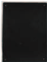
LIAT YOSSFIFOR Dust dance 11 , 2016 graphite powder oil and water on paper 9 x 12 " 22.9 x 30.5 cm. Edition unique Inv# 4934.unique