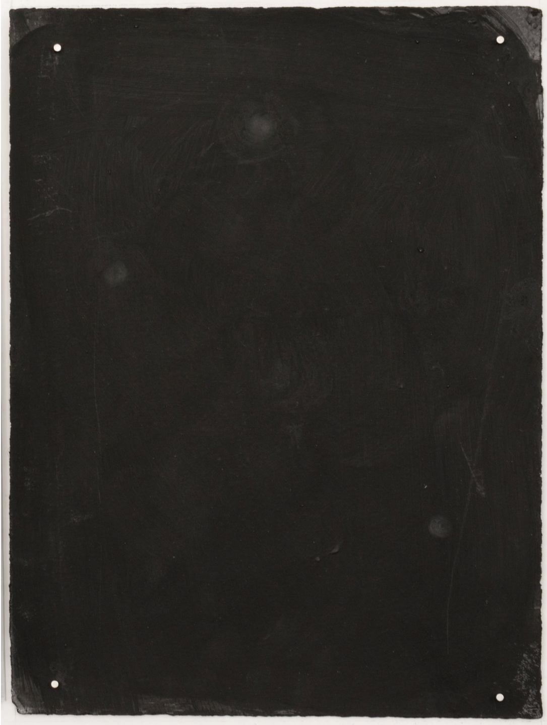
Dust dance 7, 2016 Polvo de grafito, óleo y agua sobre papel 9 x 10 in. 22.9 x 25.4 cm.