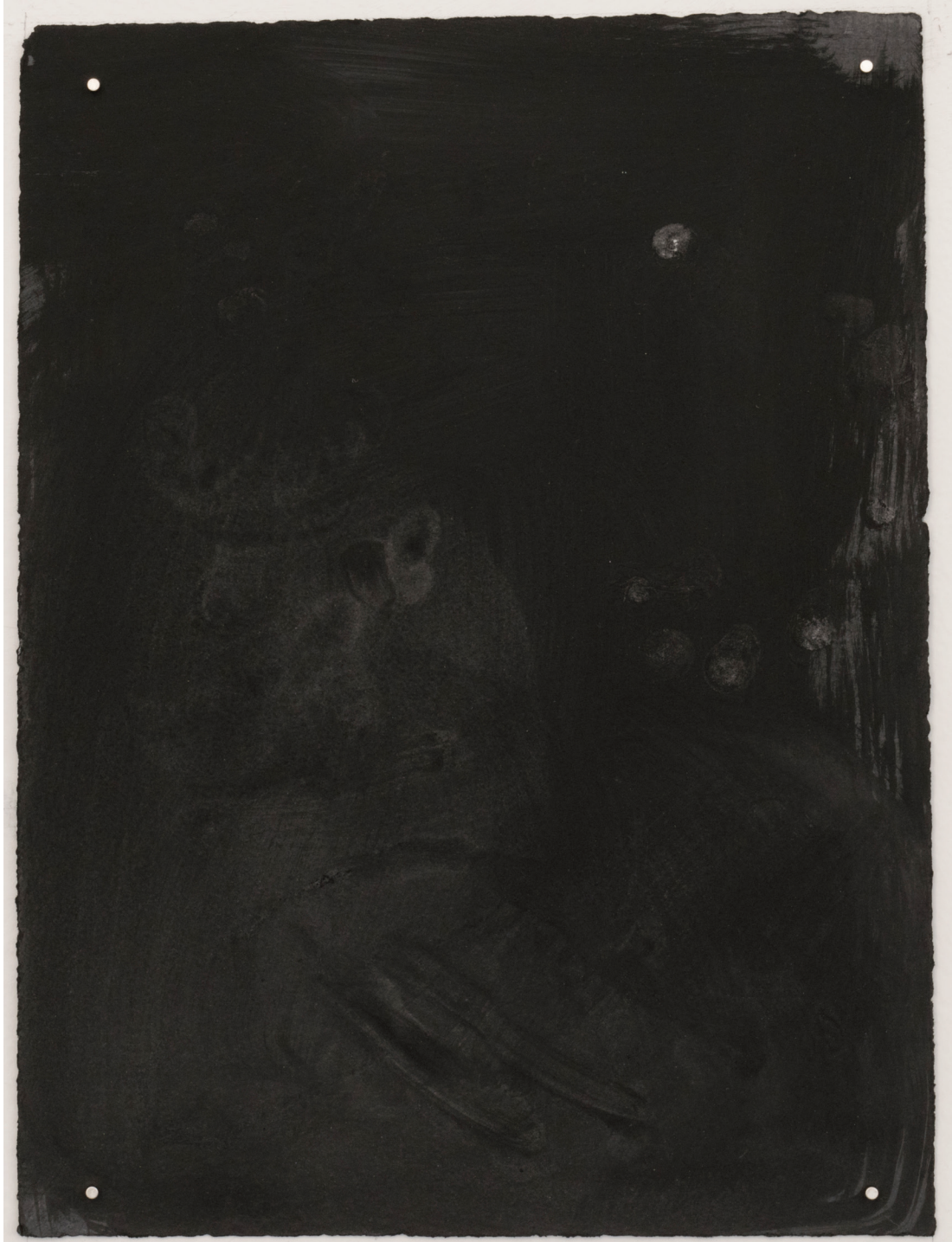
Dust dance 6, 2016 Polvo de grafito, óleo y agua sobre papel 9 x 10 in. 22.9 x 25.4 cm.