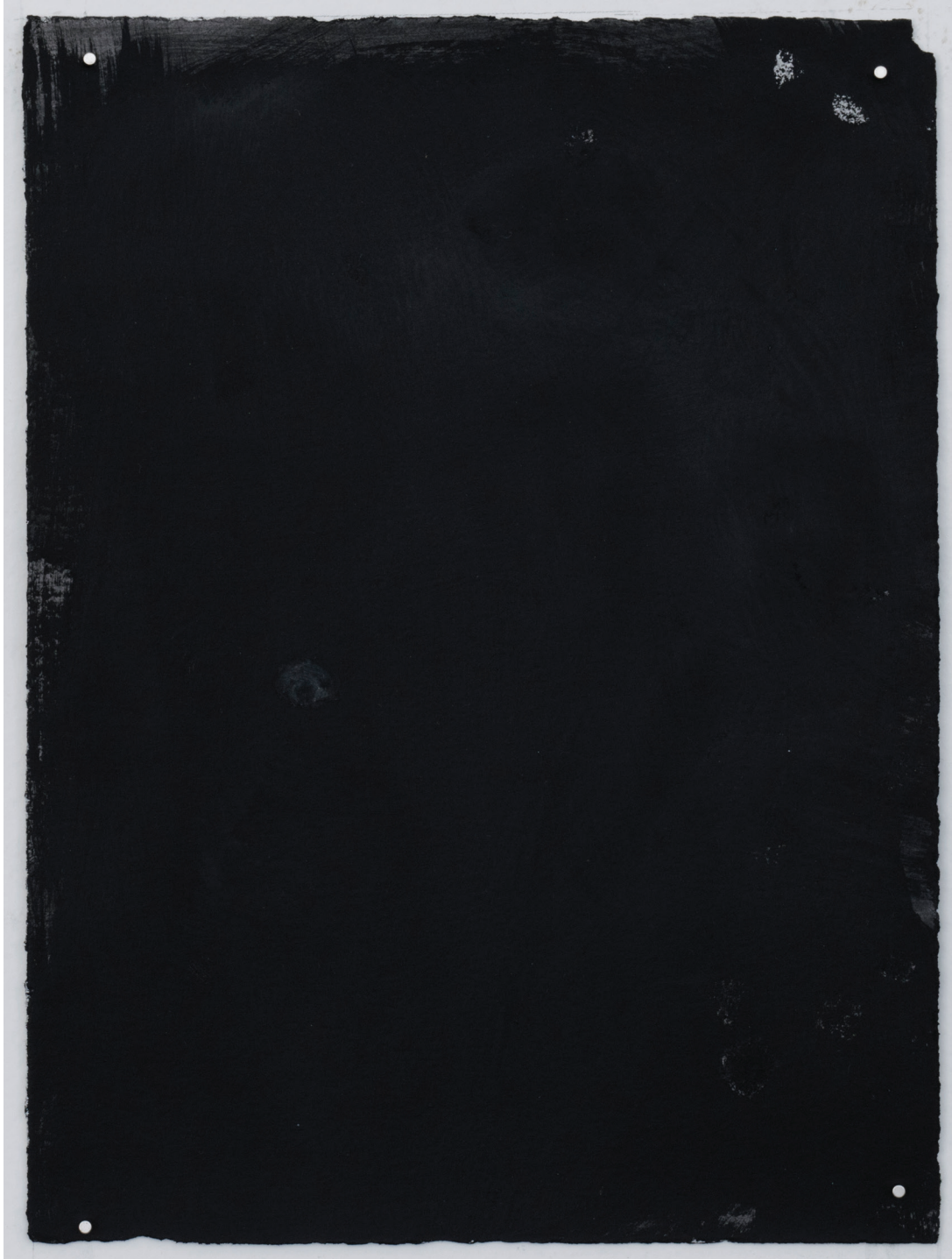
Dust dance 9, 2016 Polvo de grafito, óleo y agua sobre papel 9 x 10 in. 22.9 x 25.4 cm.