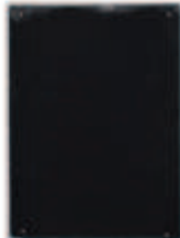
LIAT YOSSFIFOR Dust dance 8 , 2016 graphite powder oil and water on paper 9 x 12 " 25.4 x 34.3 cm. Edition unique Inv# 4931.unique