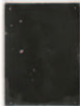
LIAT YOSSFIFOR Dust dance 13 , 2016 graphite powder oil and water on paper 9 x 12 " 22.9 x 30.5 cm. Edition unique Inv# 4936.unique