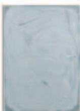
LIAT YOSSFIFOR Gray swirl I , 2016 Oil on linen Dimensions: 42 x 30 " 106.7 x 76.2 cm. Edition unique Inv# 4301.unique