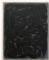
LIAT YOSSFIFOR Figure III , 2016 Oil on linen Dimensions: 22 x 20 " 55.9 x 50.8 cm. Edition unique Inv# 4300.unique