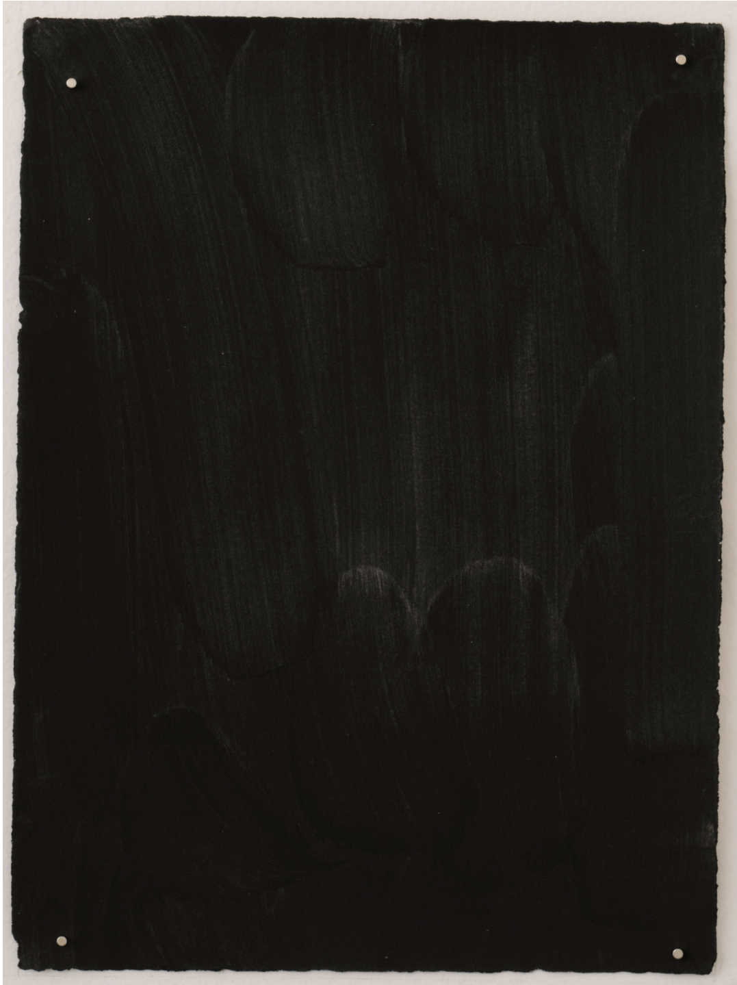
Dust dance 4, 2016 Polvo de grafito, óleo y agua sobre papel 9 x 10 in. 22.9 x 25.4 cm.