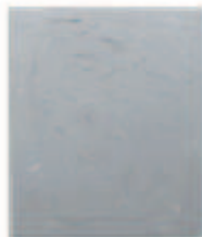
LIAT YOSSFIFOR Gray Mass II , 2016 Oil on linen Dimensions: 83 x 70 " 210.8 x 177.8 cm. Edition unique Inv# 4305.unique