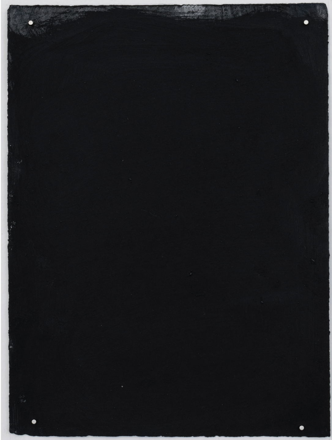
Dust dance 8, 2016 Polvo de grafito, óleo y agua sobre papel 9 x 10 in. 22.9 x 25.4 cm.